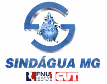
IMAGEM DA ESTATAL COPASA VAI SENDO DESCONSTRUÍDA PELA TERCEIRIZAÇÃO

H á alguns anos, um leiturista foi mutilado por um pit bull, quando fazia seu trabalho em uma residência, em Betim. Num outro episódio, policiais usaram uniforme da empresa, para abordar residências em aglomerados, disfarçados para uma investigação.